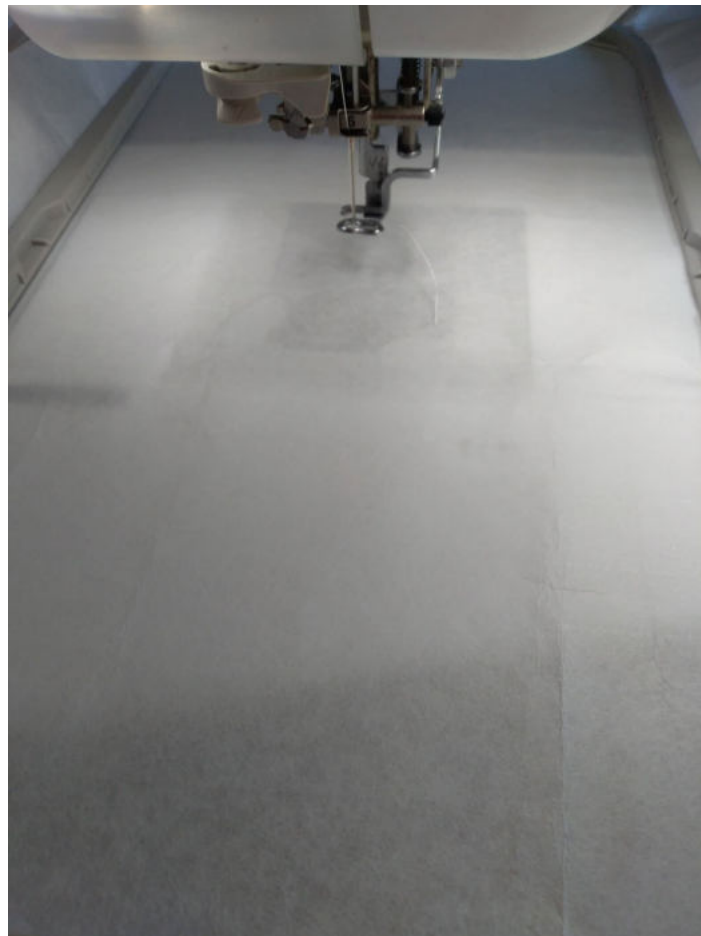
Beispiel: Eingespanntes Ausreißvlies

Das Stickvlies wird trommelfest in den Rahmen eingespannt.